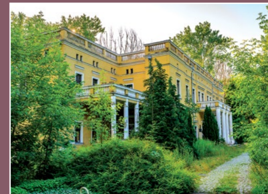
Pałac w Pietronkach Palast in Pietronki