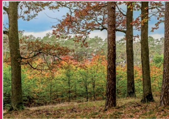
Pod Gontyńcem jesienią Herbst auf dem Tempelberg