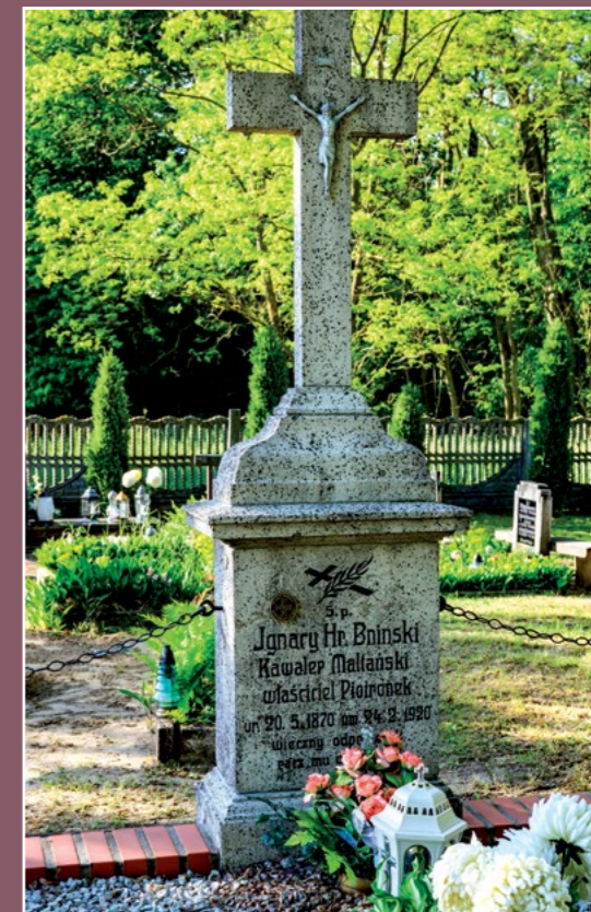
Nagrobek hrabiego Bnińskiego Grabstein des Grafen Bniński