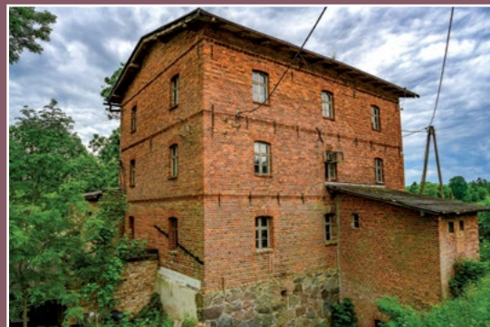
Dawny młyn w Trojance Alte Mühle in Trojanka