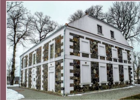
Kościół w Wyszynach- niegdyś parafia chodzieska Kirche in Wyszyny – einst im chodziesen Pfarrbezirk