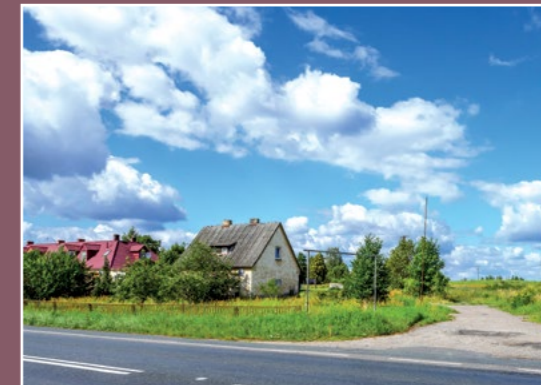
Zabudowa Kierzkowic (dawny Nowy Folwark) Bebauung von Kierzkowice

Okres panowania pruskiego zostaje na krótko przerwany dzięki zwycięstwom armii francuskiej i utworzeniu Księstwa Warszawskiego.