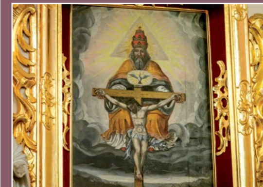
Cudowny obraz św. Trójcy Wunderbares Bild der Dreifaltigkeit

W 1738 r. kościół ten miał księdza Polaka, którego wizytator kościelny nakazał zastąpić Niemcem. Rosnąca liczba niemieckich katolików w Chodzieży powoduje przeniesienie nabożeństw dla nich do kościoła św. Trójcy (a pod koniec XVIII w do kolegiaty). Przyczyną był też coraz gorszy stan techniczny drewnianej budowli.