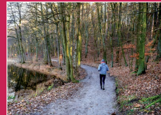
Na żółtym szlaku turystycznym Auf dem gelben Wanderweg