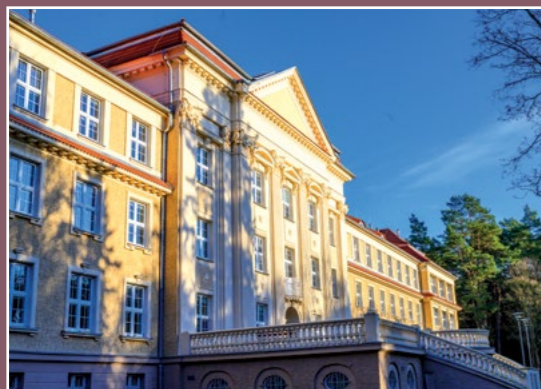
Sanatorium z 1925 r. Kurhaus aus dem Jahr 1925

W 1920 r. miasto wraca do Polski ale większość okolicznych majątków ziemskich nadal pozostawała w rękach niemieckich.