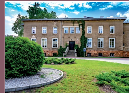
Pałac w Oleśnicy Palast in Oelsnitz