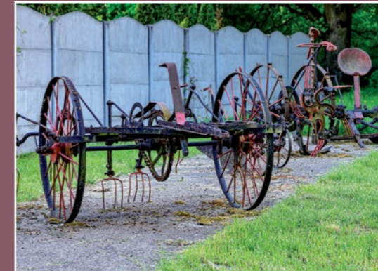
Dawne maszyny rolnicze Stróżewko Alte Landwirtschaftsmaschinen in Stróżewko