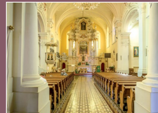
Wnętrze kościoła Innenraum der Kirche