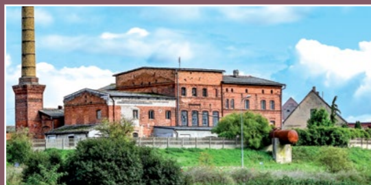
Zabudowania folwarczne Strzelce Vorwerks Gebäuden in Strzelce