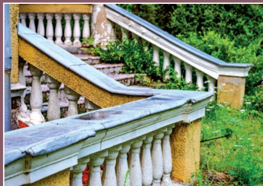
Schody do pałacu Treppe zum Palast