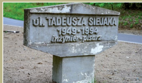
Ulica Siejaka Siejak Strasse