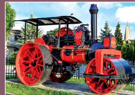
Dawna maszyna parowa Alte Dampfmaschine