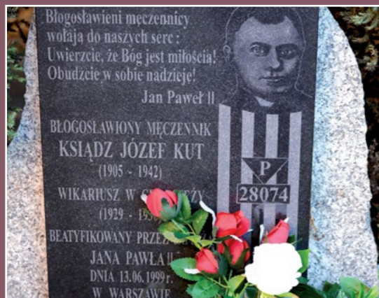
Błogosławiony męczennik Józef Kut Selige Martyr Józef Kut