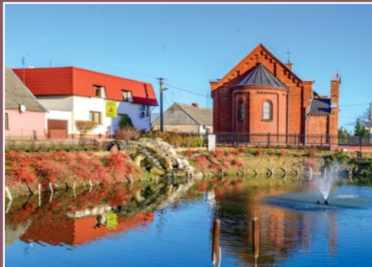
Staw w Stróżewie Teich in Stróżewo