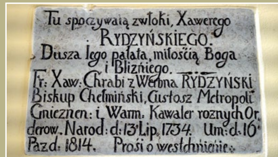
Epitafium z kościoła św. Floriana Grabschrift aus der Kirche des hl. Florian