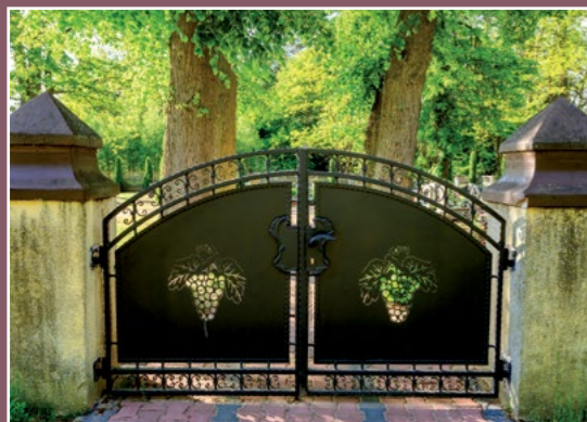
Brama cmentarna Pietronki Friedhofstor in Pietronki

Klasyfikacja pruska z 1773 r. wymienia 234 mieszkańców, wszyscy luteranie. Pośród nich było 12 rodzin pracowników najemnych i rzemieślników. Było to 5 pasterzy, 1 stróż, 2 szewców, 2 sukienników 1 garncarz. Po 1779 r. gdy w Chodzieży powstała gmina ewangelicka. Podanin odłączył się od Bukowca i przyłączył do gminy chodzieskiej.