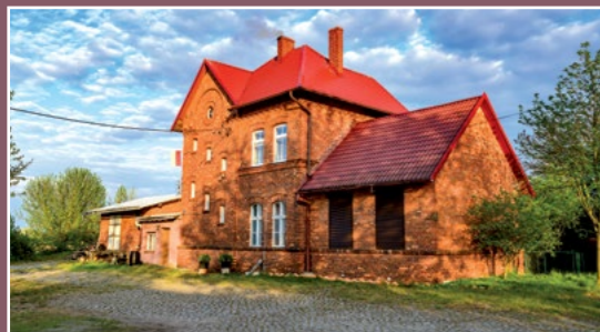
Dawny dworzec w Zacharzynie Alter Bahnhof in Zacharzyn