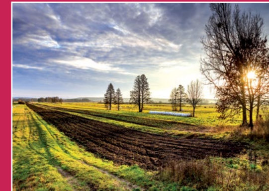
Pola i łąki w dolinie Noteci Felder und Wiesen im Netzetal