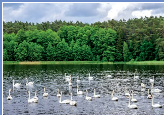
Ostoja ptactwa na stawach Refugialgebiet der Vogel auf den Teichen