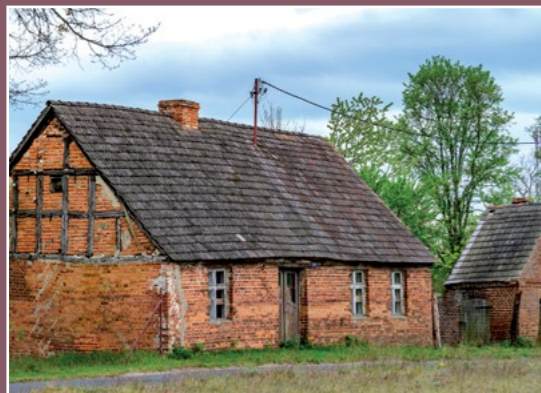
Domy w Kamionce Häuser in Kamionka