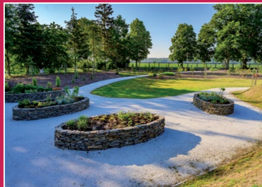
Arboretum w Podaniu Arboretum in Podanin