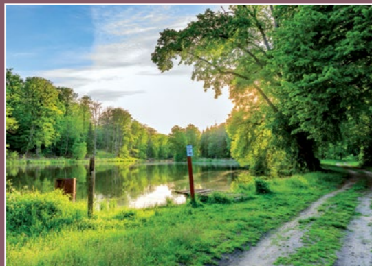
Staw w Papierni Teich in Papiernia