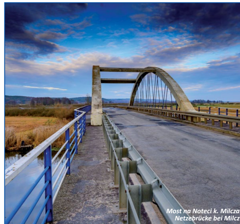
Most na Noteci k. Milcza Netzebrücke bei Milcz

Walory krajobrazowe gminy najlepiej poznawać w wędrując jednym z biegnących przez jej teren szlaków turystycznych. Węzeł szlaków znajduje się przy dawnym schronisku młodzieżowym za Domem Kultury.