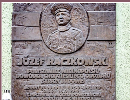
Powstaniec wielkopolski Einer der Groß Polnischen Aufständern

Powrót Chodzieży do Polski po I Wojnie Światowej był możliwy dzięki polskiej działalności narodowej w początkach XX w. Istniały polskie organizacje kulturalno – oświatowe: