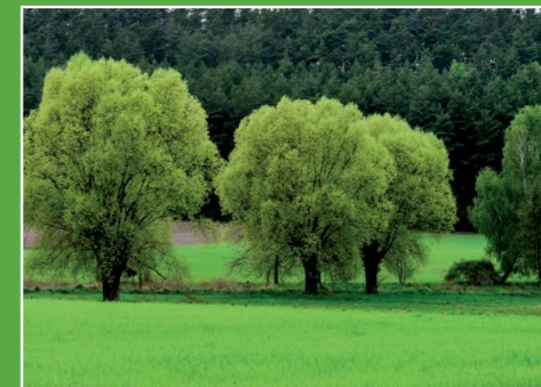
Drzewa w wiosennej szacie Bäume im Frühlingskleid