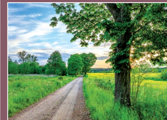
Droga do Trojanki Feldweg nach Trojanka