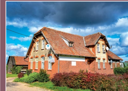
Dawna szkoła Alte Schule