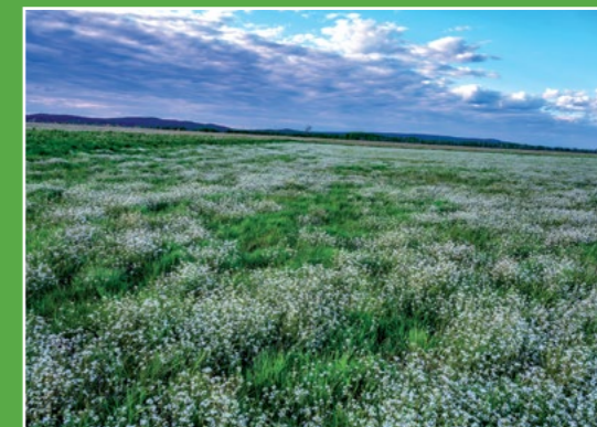
Wiosenne łąki nad Notecią Frühlingswiesen im Neztetal