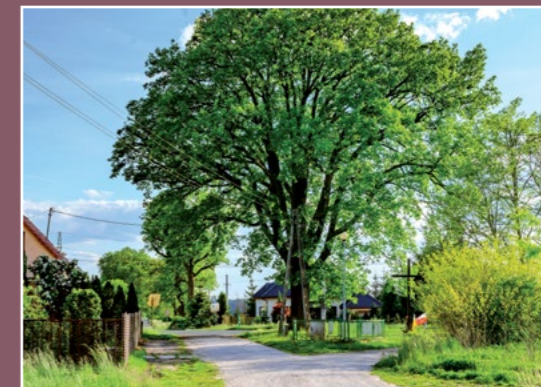
Pomnikowy dąb Uralte Eiche