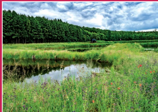
Stawy w Trojance Karpfenteiche in Trojanka