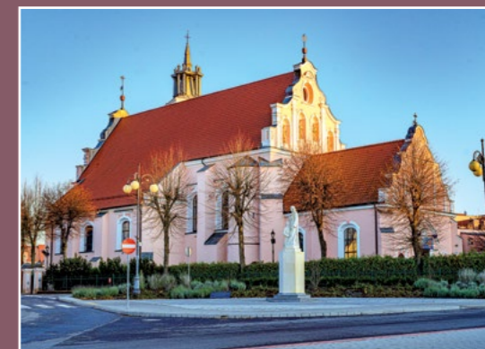
Kościół św. Floriana Heilige Florian Kirche