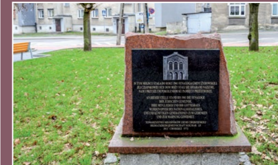
Miejsce po synagodze Hier stand die Synagoge