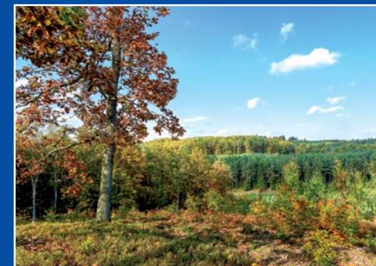
Widok na Gontyniec Aussicht auf Tempelberg