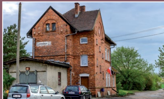
Dawny dworzec kolejowy Strzelce Alter Bahnhof in Strzelce