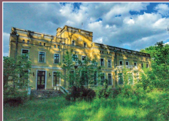
Pałac Pietronki Palast Pietronki