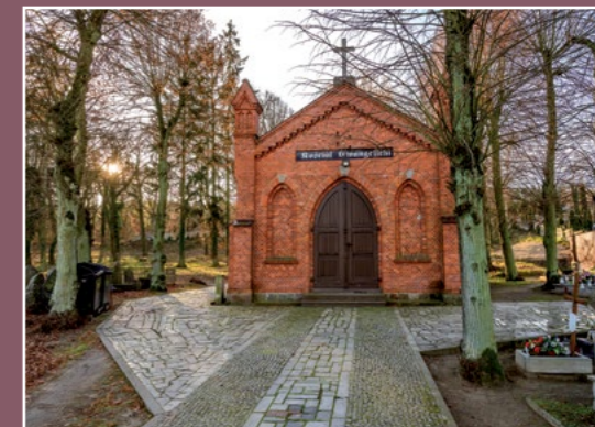
Kaplica ewangelicka Evangelische Kapelle

Przy kościele św. Floriana stoi Pomnik Wolności, odbudowany w 2018 roku. Pierwszy pomnik stanął w 1931 r., zniszczyli go Niemcy podczas okupacji.