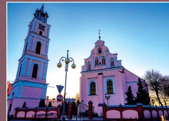
Kościół św. Floriana Heilige Florian Kirche