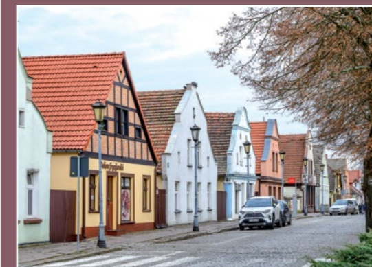
Niegdyjsze Nowe Miasto Einstige Neustadt