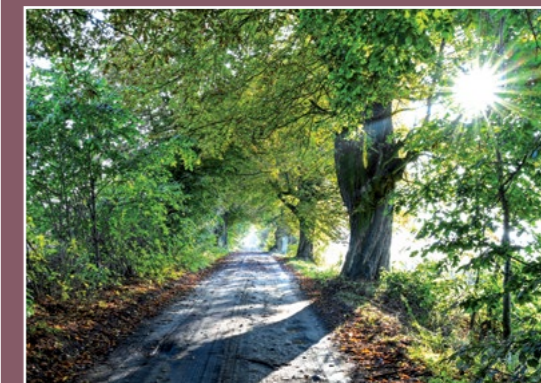
Pomniki przyrody przy drodze do Trojanki Naturdenkmal am Weg nach Trojanka