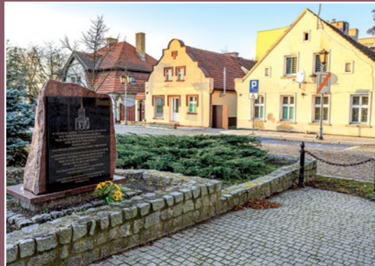
Tu stał kościół ewangelicki Hier stand die evangelische Kirche

jakiegoś terenu decyduje o wyznawanej przez swoich poddanych religii.