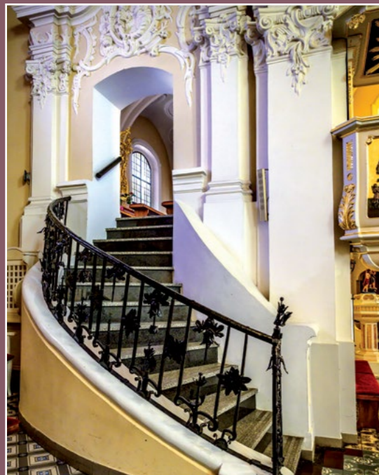
Wnętrze kościoła św. Floriana Innenraum der Heiligen Florian Kirche