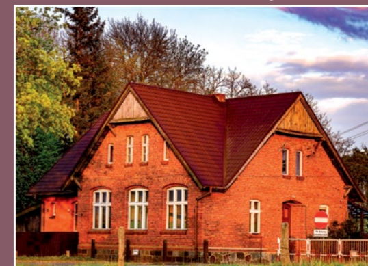
Szkoła w Strzelcach Schule in Strzelce