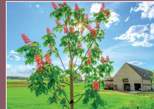
Młode kasztany w Słomkach Junge Kastanienbäume in Słomki

We wsi zachowała się stara zabudowa z początku XX w.