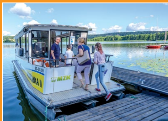
Statek spacerowy Touristenschiff

uczucielską stanowią uznani muzycy wykładający również na „dorosłych” Międzynarodowych Warsztatach Jazzowych w Chodzieży.