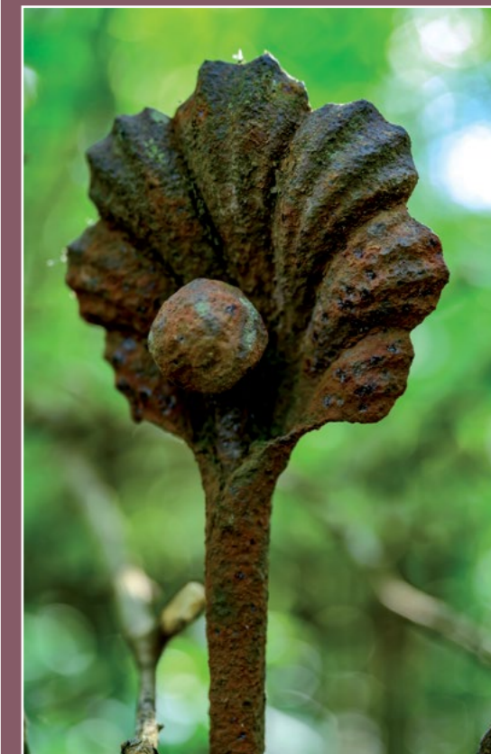
Detail z cmentarza ewangelickiego Stróżewice Detail aus dem evangelischen Friedhof in Stróżewice