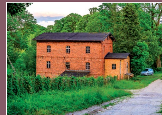
Młyn w Trojance Mühle in Trojanka