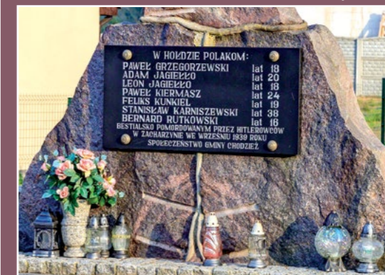
Pomnik pomordowanym w 1939 r. Denkmal der Ermordeten im Jahr 1939