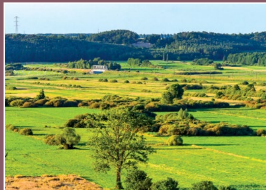
Dolina Noteci z Nietuszkowa Netzetal von Nietuszkowo gesehen