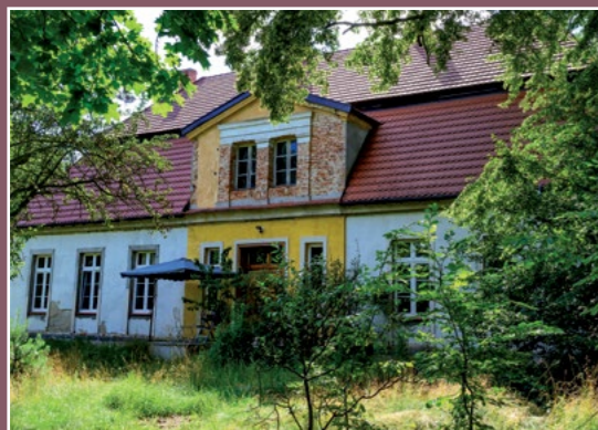
Dwór w Oleśnicy Herrenhof in Oelsnitz

jest z tego, że sprzedawał duże ilości żużlu pochodzącego z działających w poprzednich stuleciach prymitywnych hut żelaza w Trojance, gdzie pozyskiwano żelazo z rud ziemnych. Przeszarżała technologia powodowała, że w pozostałym z wytopu żużlu była jeszcze duża zawartość żelaza możliwa do odzyskania w nowoczesnych hutach.