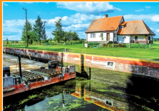
Noteca śluza Netzeschleuse