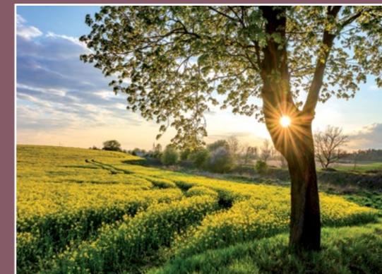
Urodzajne pola okolic Strzelce Fruchtbare Felder bei Strzelce