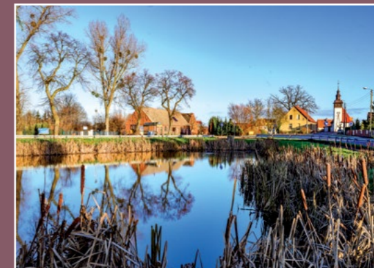
Staw w centrum wsi Teich im Dorfzentrum