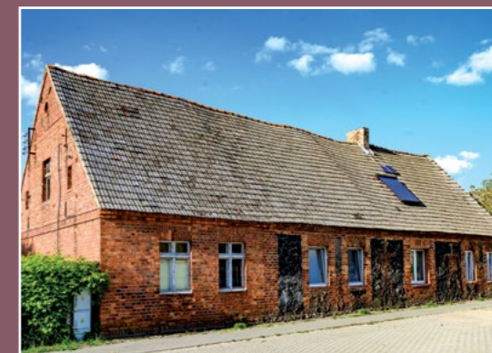
Dom z kamienia Podanin Feldsteinhaus in Podanin