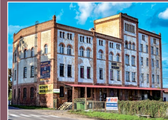
Dawny młyn Kłos Alte Kloss Mühle