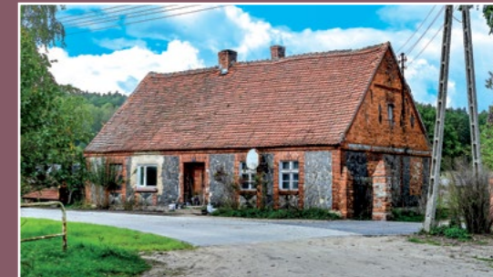
Dom z polnych kamieni i cegły Haus aus der Feldsteinen und Ziegeln

W owym czasie centrum miasta opasane było murem miejskim; w 1552 r. mowa jest o starej bramie miejskiej, przez którą prowadzi droga do Oleśnicy.