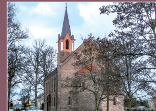
Kościół w Bukowcu Kirche in Bukowice

Dla osadnictwa niemieckiego „zasłużył” się szlachecki ród Grudzińskich, który w latach 1649 - 1830 władał okolicą Chodzieży. Spr-