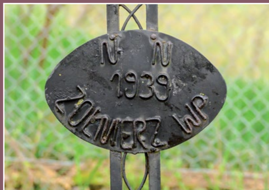
Grób nieznanego żołnierza w Milczu Grabmal des unbekanntenen Soldaten in Milcz