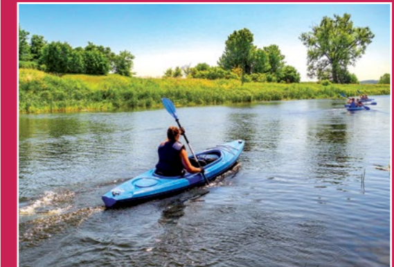
Na Noteci Auf der Netze