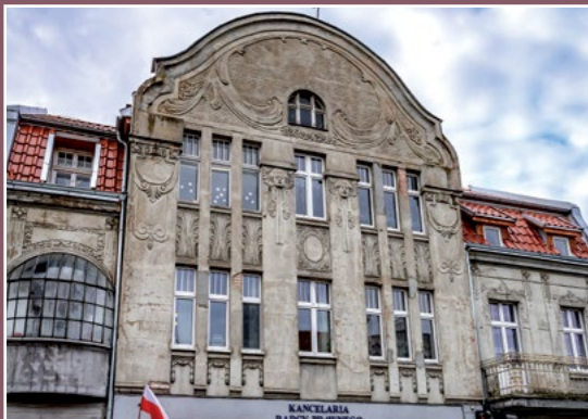
Secesyjna kamienica w Chodzieszy Jugendstil Miethaus