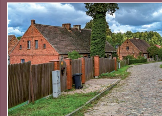
Dawna osada Siebenhaus Alte Siedlung Siebenhaus