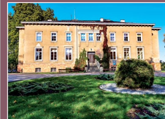
Pałac w Oleśnicy Palast in Oelsnitz