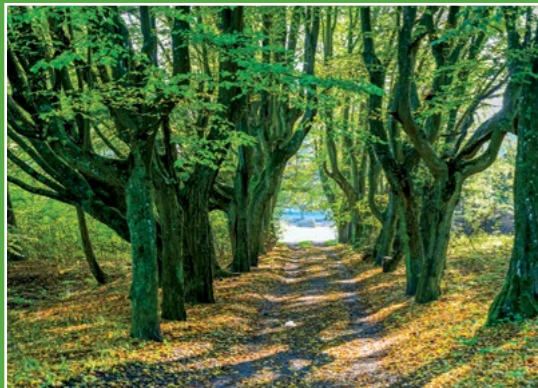
Aleja grabowa w Oleśnicy Hainbuchenallee in Oelsnitz