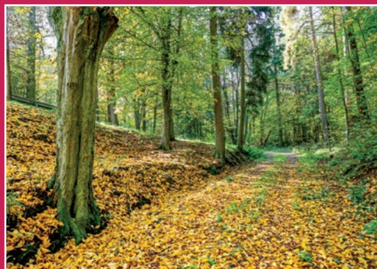
Droga w Karczewniku Weg in Karczewnik