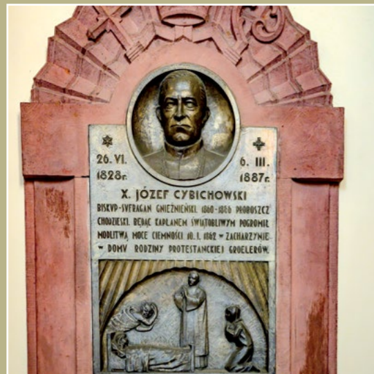
Wspomnienie egzorcyzmów Exorcismus Erinnerung