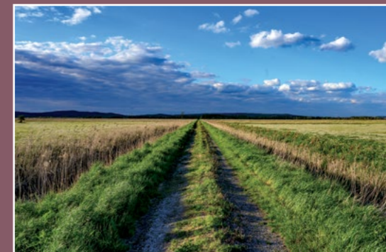
Druga koło Ciszewa Weg bei Ciszewo

W średniowieczu istniał tu folwark nad Notecią. W 1450 r. ugoda między Synochą wdową po Trojanie z Łekna a teściem mówi o „wyspie Czeszewo”. Folwark ten leżący na wywyższeniu musiał być w całości otoczony wodą i moczarami. W 1905 r. miało 6 mk.