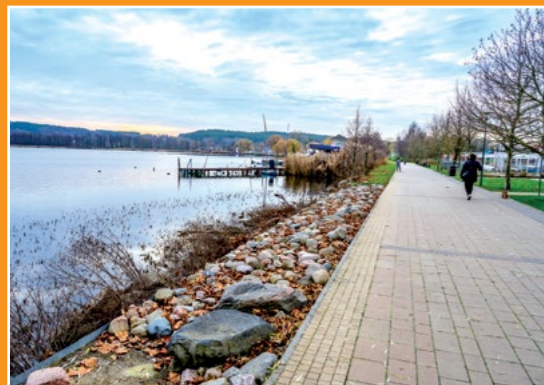
Promenada chodzieska Promenade in Chodziesen