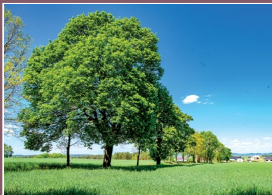
Droga z Rataj do Podanina Alter Weg von Rattai nach Podanin