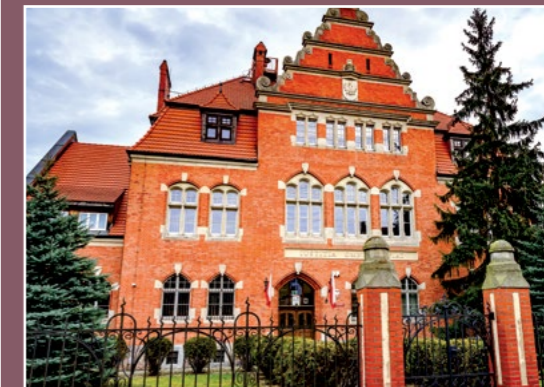
Sąd rejonowy w Chodzieży Bezirksamt in Chodziesen