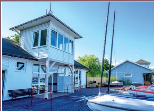
Przy chodzieskiej promenadzie An der Promenade in Chodziesen