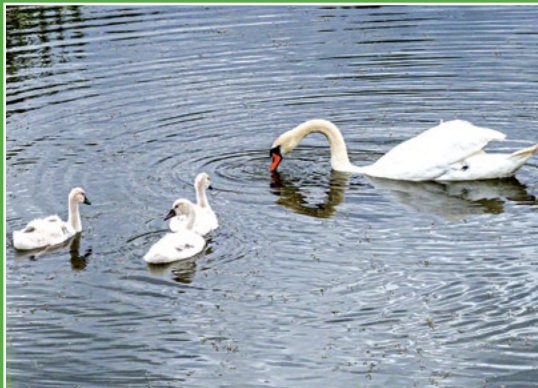
Wyjątkowe pisklęta łabędzie... Einmalige Schwänen Küken