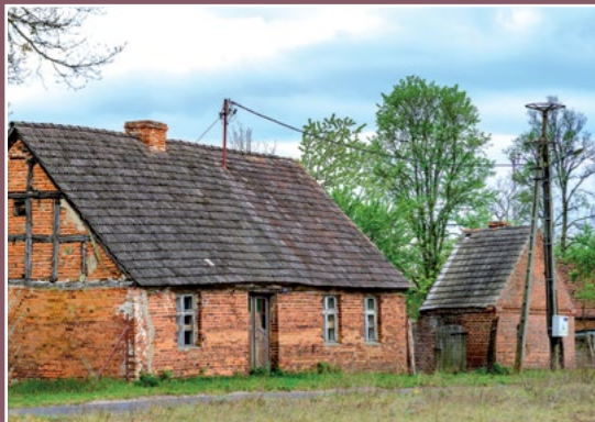
Stara zabudowa Kamionki Alte Bebauung in Kamionka