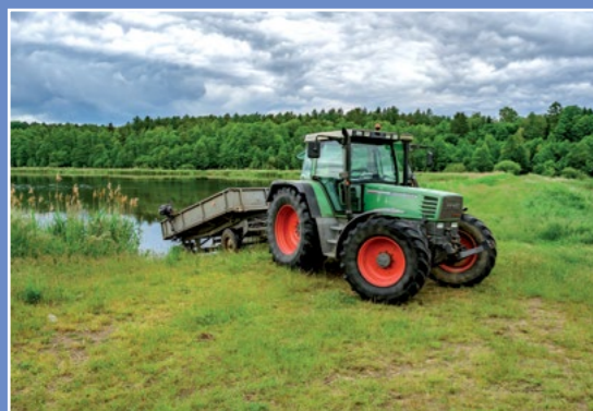
Duże ilości paszy dowozi traktor Große Futtermengen bringt der Traktor