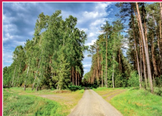
Szlak pieszy czerwony okolice Konstąntynowa Roter Wanderweg bei Konstąntynowo