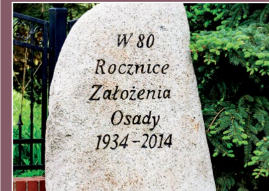
Pamiętkowy kamień w Mirowie Gedenkstein in Mirowo

Kroniki podają, że w 1703r. były takie wichury, że obalały domy i drzewa. W 1708 r. kronikarz notuje – mrozy wielkie, młyny stoją stąd głód brak chleba i napojów