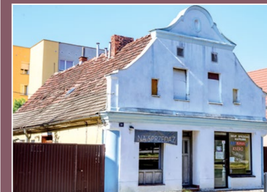
Dom sukiennika Tuchmacherhaus