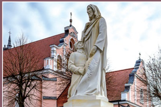
Pomnik Wolności Denkmal der Freiheit