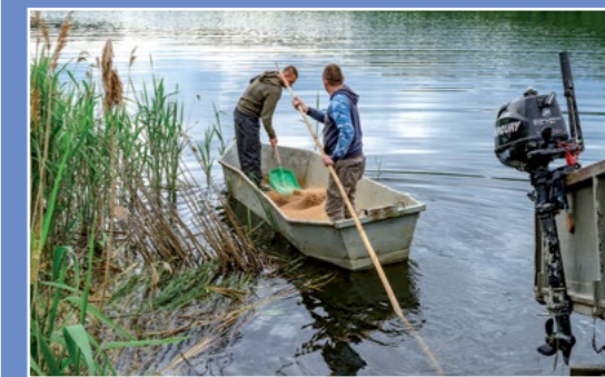
Praca rybaków Fischerarbeit