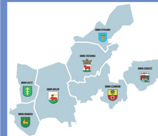
Gminy członkowskie NGR Mitgliedsgemeinden der NGR

NGR wdraża LSR w ramach PO „Rybnictwo i Morze” na obszarze 7 gmin członkowskich, tj.: Drawsko, Krzyż Wlkp., Szydłowo, Trzcianka, Wieleń, Chodzież i Czarnków. Teren Gmin wchodzący w skład NGR to obszar, którego największym atutem turystycznym jest przyroda: lasy zajmujące połowę powierzchni, liczne jeziora i gęsta sieć rzek. Sieć szlaków do uprawiania różnego rodzaju wędrówek (pieszych, rowerowych, kajakowych, konnych) uzupełniana jest o elementy infrastruktury turystycznej, przybywa też miejsc noclegowych i placówek gastronomicznych. Liczne jeziora na tym terenie przyciągają wędkarzy, a rzeki o przebiegu górskim (Piława, Dobrzyca, Bukówka) dają też możliwość łowienia ryb łososiowatych. Tutejsze lasy słyną z bogactwa runa leśnego. Kajakarze korzystają z popularnych szlaków Gwdy oraz jej dopływów: Dobrzyca, Piławy i Rurzyca, ale na wytrawnych wodniaków czekają też inne, trudniejsze rzeki: Bukówka, Krępicza, Łomnica, Człopica. Na terenie NGR łącznie funkcjonuje około 50 podmiotów rybackich, w tym 43 to hodowcy stawowi, a 7 to użytkownicy jezior. Całkowita wartość produkcji to ponad 11,5 mln PLN.