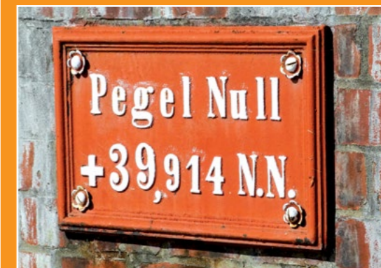
Poziom Noteci Wasserpegel der Netze