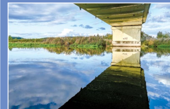
Most na Noteci Netzebrücke