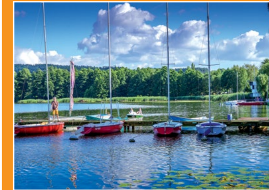
Chodzieska przystań Anlegestelle in Chodziesen