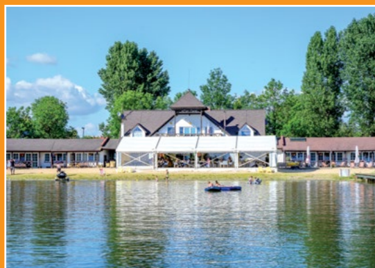
Łazienki chodzieskie Chodzieser Bad