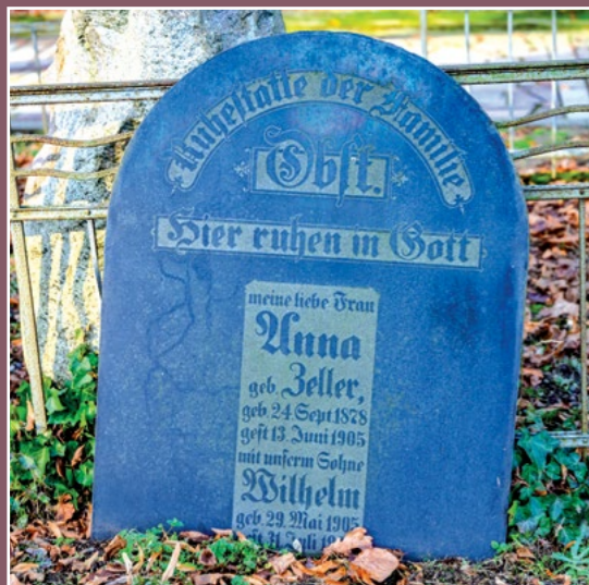
Nagrobek z cmentarza ewangelickiego w Chodzieży Grabstein aus dem evangelischen Friedhof in Chodziesen

W 1709 r. dżuma powoduje śmierć 624 dorosłych mieszkańców Chodzieży, większość mieszkańców ucieka masowo do Morzewa, skąd dziedziczka miasta - Teresa Grudzińska każe ich przemocą w dniu 9 listopada 1709 r. sprowadzić z powrotem.