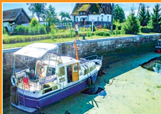
Śluza Romanowo Schleuse in Romanowo

terdamie i aż do granic Polski spełnia wymagania stawiane tego typu drogom wodnym (dostępna dla statków długości 80 metrów i 9,5 metra szerokości). W Polsce prowadzi ona dolną Odrą, Wartą i Notecią, dalej przez Kanał Bydgoski Wisłą. W naszym kraju droga wodna spełnia wymagania niższej klasy (szerokość szlaku wodnego 16 do 25 metrów, gwarantowana głębokość zaledwie 1,2 -1,5 metra, prześwity pod mostami 3,5 -4 metry).