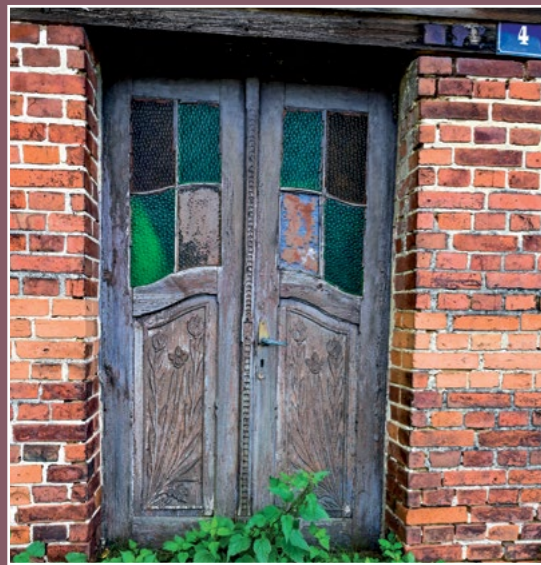
Stare drzwi Alte Tür