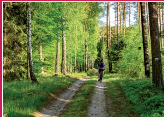
Na rowerowym szlaku Auf dem Radweg

do Oleśnicy. Skrajem wsi, obok dawnego pałacu Oleśnickich i dworu, przez pozostałości parku dworskiego a następnie drogą przez las częściowo przy stawach docieramy do Trojanki – dawnej osady przemysłowej (kuźnica żelaza), stąd początkowo leśną drogą, potem asfaltową do Nietuszkowa. Wieś zostawiamy po prawej stronie, chociaż warto do niej zajechać aby skręcić w osiedle i podziwiać panoramę Doliny Noteci. Na miłośników zabytków czeka pałac i zabudowania gospodarcze, które można podziwiać z daleka, gdyż są własnością prywatną. Niezależnie od wybranego wariantu zjeżdżamy stromo w dół z wysokiej skarpy na której leży Nietuszkowo.