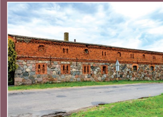
Dawny folwark w Milczu Altes Vorwerk in Milcz