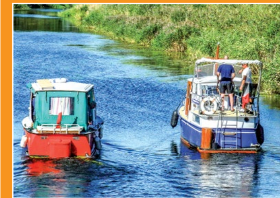
Łodzie turystyczne na Noteci Touristische Boote auf der Netze