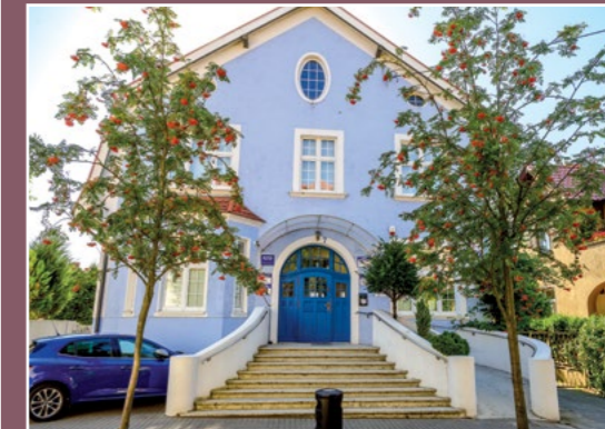
Willa w Chodzieży Villa in Chodziesen