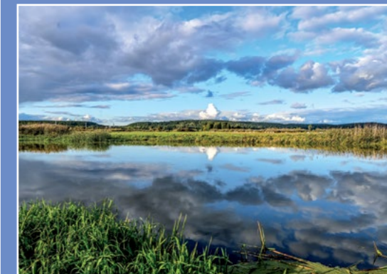
Stawy w Oleśnicy Karpfenteiche in Oelsnitz

Podziwiamy stawy z daleka i z miejsc do tego wyznaczonych; między stawami w Oleśnicy, drogą do Trojanki prowadzą szlaki turystyczne, dotrzemy nimi do dawnej osady Papiernia ciesząc oczy i uszy bogactwem otaczającej nas przyrody.