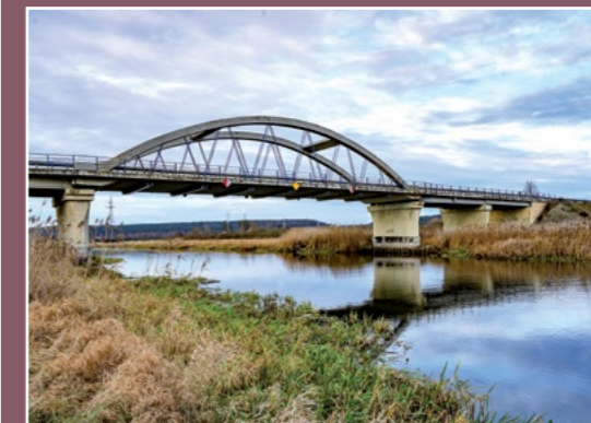
Most na Noteci Netzebrücke