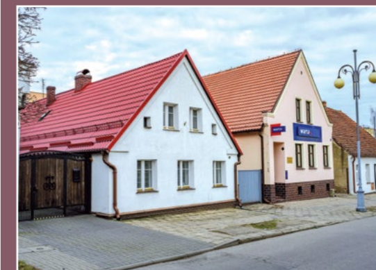
Dawne domy sukienników Alte Tuchmacher Häuser