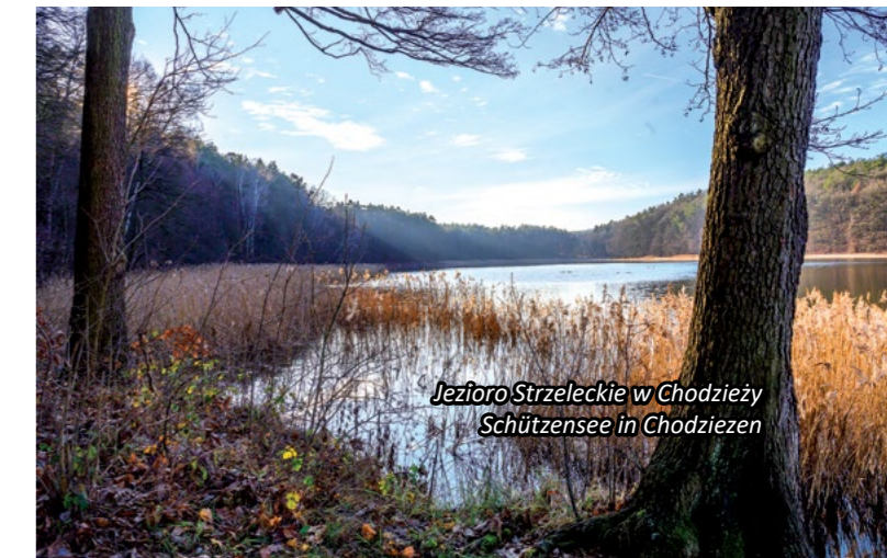
Jezioro Strzeleckie w Chodzieży Schützensee in Chodziezen

Okolice Chodzieży przed długi okres swoich dziejów leżały na pograniczu. Za pierwszych Piastów granicę z pomorskimi plemionami wyznaczała rzeka Noteć, z grodem w Ujściu strzegącym przeprawy przez rzekę. Na trasie wiodącej z Poznania do Ujścia a dalej nad Bałtyk wybudowano zamek chodzieski. Na potrzeby tego zamku powstawały liczne wsie służebne takie jak Rataje, Stróże, Strzelce, Podanin.