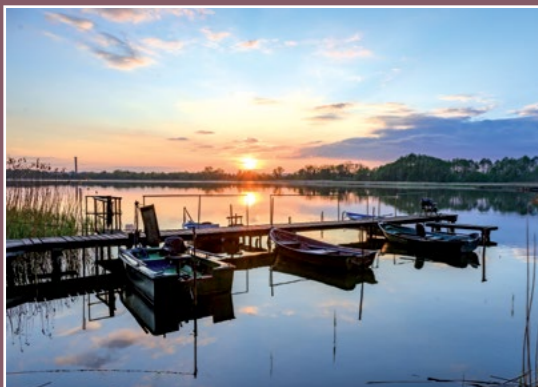
Na plaży w Ratajach Auf dem Strand in Rattai