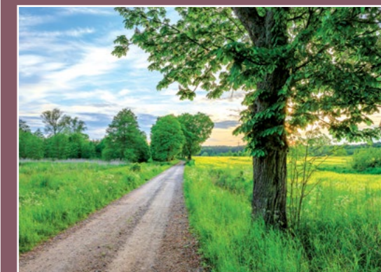
Droga do Trojanek Weg nach Trojanka