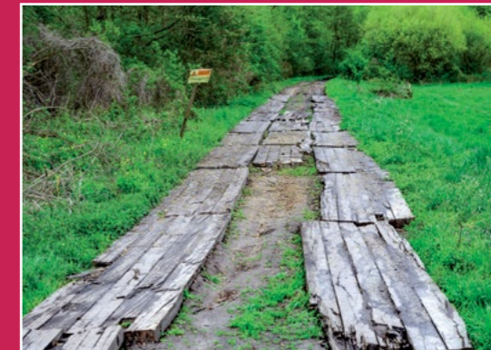
Droga ku Noteci Weg zur Netze