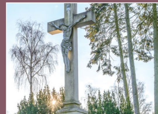
Na chodzieskim cmentarzu Auf dem chodziesener Friedhof