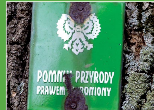
Wiekowy pomnik przyrody Uralter Naturdenkmal