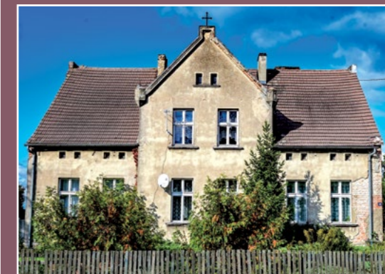
Dawna pastorówka Altes Pfarrhaus