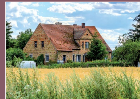
Zagroda w Trzaskowicach Bauernhof in Trzaskowice