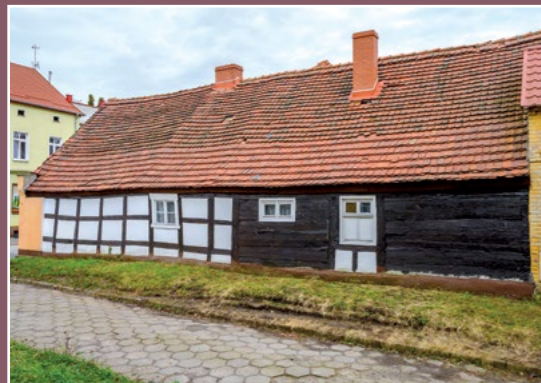
Stare domy w Chodzieży Alte Häuser in Chodziesen