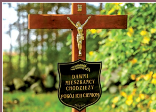
Pamięci dawnych mieszkańców Gedenken an ehemalige Einwohner

Niemcy jeszcze domagali się utrzymania tego kościoła ale nawet władze pruskie wydały w 1815 r. zakaz odprawiania w nim nabożeństw do czasu „ aż kościół nie będzie restaurowany”