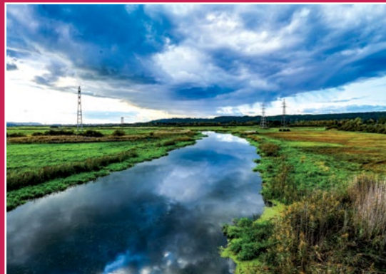
Dolina Noteci Netzetal

nagrobków) i starą drogą wysadzaną akacjami i lipami do lasu. Szlak skręca w lewo stopniowo pnąc się pod górę. Na wzniesieniu spotkamy znaki szlaku czerwonego; krótki odcinek oba szlaki wiodą razem, następnie szlak czarny prowadzi dalej na południe. Tutaj w terenie brakuje znaków, trzeba po dotarciu do szerokiej drogi leśnej skręcić w prawo a następnie znowu w prawo drogą biegnącą w stronę Chodzieży. Wychodzimy na skraju lasu na drogę prowadzącą do stoku narciarskiego; w lewo przecinamy drogę krajową 11, dalej ul. Kasprzaka, skręcamy w prawo i pod górę przez las dochodzimy do połączenia ze szlakiem żółtym, gdzie skręcamy w lewo. Pod wiaduktem kolejowym i wzdłuż brzegów J. Karczewnik. Przy kolejnym wiadukcie idziemy na wprost i wspinamy się pod górę aby dotrzeć do punktu naszego startu.