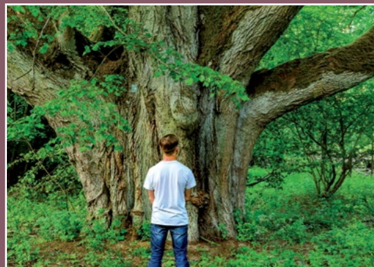
Pomnikowa lipa w Papierni Linde in Papiernia - Naturdenkmal