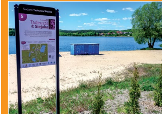
Plaża Karczewnik Strand in Karczewnik

Północną granicę gminy Chodzież stanowi rzeka Noteć, którą prowadzi MDW E 70. Międzynarodowa Droga Wodna MDW E -70 to projekt łączący zachodnią Europę z Kaliningradem. Rozpoczyna się w Rot-