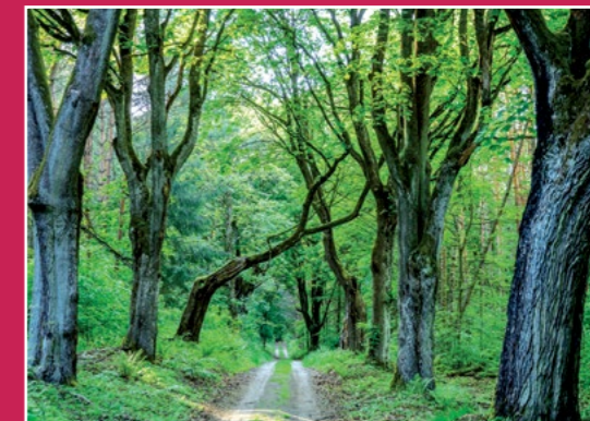
Szlak czerwony koło Papierni Roter Wanderweg bei Papiernia