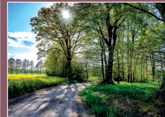
Polna droga do Stróżewic Feldweg nach Stróżewice

Stróżewice dawniej zwane były Stróżewskie Olendry. Założył wieś w 1730 r. Karol Grudziński osadzając na zalesionym terenie 20 osadni- ków z Niemiec. W 1773 r. było tu 47 gospodarstw zamieszkałych przez 371 osób (w tym zaledwie 2 Polaków). W 1873 r. we wsi mieszkało 665 osób, zajmowała ona 1180 ha podzielonych na 98 działek.