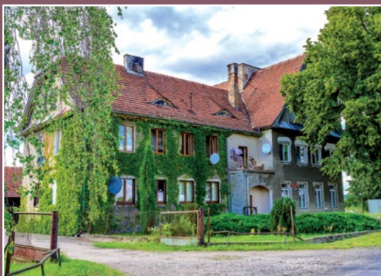
Świetlica w Stróżewicach Gemeinschaftsraum in Stróżewice