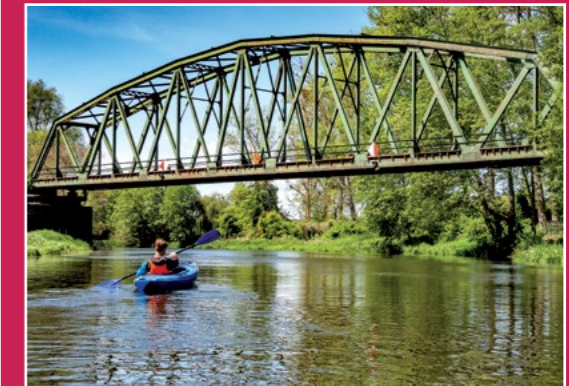
Most kolejowy w Ujściu Eisenbahnbrücke in Usch