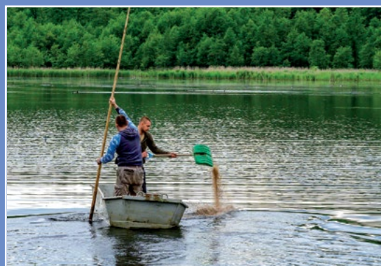
Karmienie ryb Fischfuttern

W gminie Chodzież rybactwo koncentruje się od niepamiętnych czasów w dolinie Strugi Oleśnickiej. Rybacką „stolicą” gminy jest wieś Oleśnica. Mają w niej swoją siedzibę dwa gospodarstwa rybackie, prowadzące sprzedaż sezonową karpia. Gospodarstwa nie są nastawione na turystów, nie prowadzą łowisk ani rybnej gastronomii nie ma możliwości ich zwiedzania. Widoczne dla wszystkich są prowadzone przez nie stawy, będące ozdobą krajobrazu.