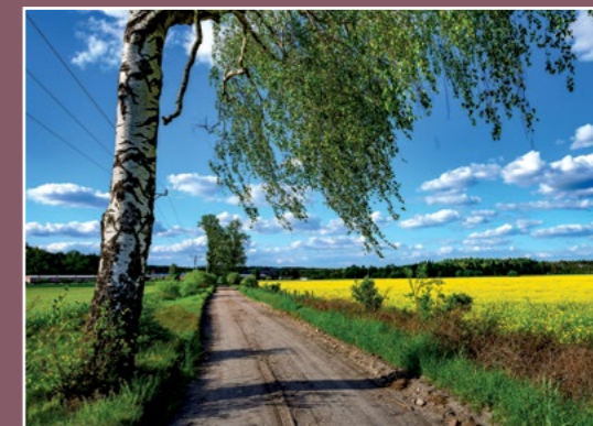
Polna droga do Stróżewka Feldweg nach Stróżewko