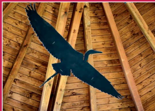
W Labiryncie Wiedzy Przyrodniczej Im Labyrinth des Naturwissens