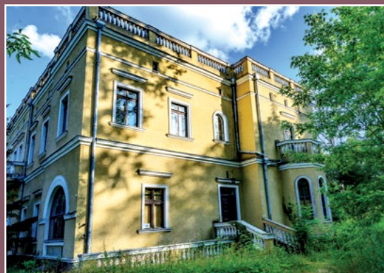
Pałac Pietronki Palast Pietronki