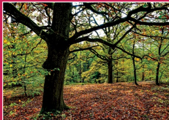
Bukowy las na Gontyńcu Buchenwald auf dem Tempelberg