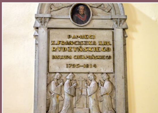
Epitafium biskupa Rydzyńskiego Grabschrift des Bischofs Rydzyński