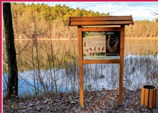
Tablica edukacyjna nad J. Strzeleckim Lehrtafel am Schützensee

Rzeka płynie dalej u podnóża skarpy, ślady po dawnym moście „krowim”, którym stada bydła przepędzano z jednego brzegu rzeki na drugi. Dopływamy do Ujścia – za mostem drogowym po lewej przystań wodna za remizą strażacką. Tutaj kończymy nasz spływ.