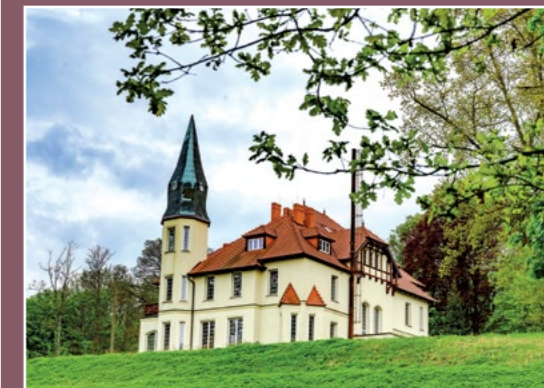
Pałac w Karczewniku Palast in Karczewnik