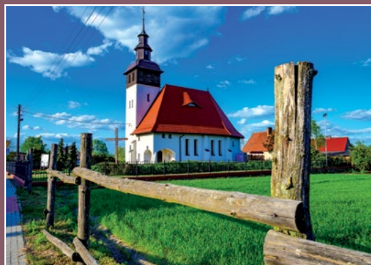
Kościół w Podaninie Kirche in Podanin