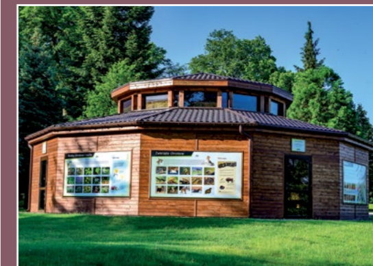
Wiata edukacyjna przy nadleśnictwie Podanin Edukationsgebäude in Ober Försterei Podanin