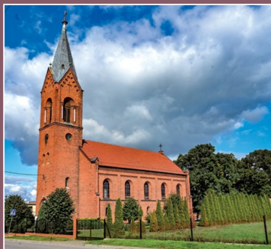
Kościół Zacharzyn Kirche in Zacharzyn