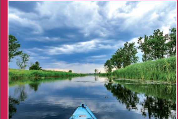
Kajakiem po Noteci Mit dem Kajak auf der Netze

Rozpoczynając spływ przy moście w Białośliwiu ( km 76) zwróćmy uwagę na miejsce, gdzie znajdowała się w dawnych czasach binduga - tutaj pnie ściętych drzew wiązano w tratwy i spławiano z nurtem rzeki. Płynąc z nurtem rzeki mijamy ( 84 km) budynek wędkarski, na km 85,5 widoczna wieża kościoła w Zacharzyniu. Dalej Miasteczko Krajeńskie; za wsią po prawej stronie przystań z pomostem – dawna kolonia Sophiadamm (km 88). Zbliżając się do wysokich wzgórz na prawym brzegu mijamy Prawomyśl – na lewym brzegu miejsce po dawnej karczmi flisaków Netzekrug. Następnie mijamy Ciszewo – po lewej stronie zabudowania suszarni pasz, dawny folwark wymieniany w dokumentach w XIV w. Przepływamy pod mostem drogowym w Milczu (km 94,8) – pomosty rybackie. Kolejny most kolejowy w Dziembowie (km 97,6). Noteć zbliża się do stromej skarpy na lewym brzegu, na niej wieś Nietuszkowo, nieco dalej, na wysokości Chrustowa na lewym brzegu ślady po dawnym moście drogowym; stał przy nim urząd celny, a dalej droga prowadziła do karczmy zwanej Buchkrug.