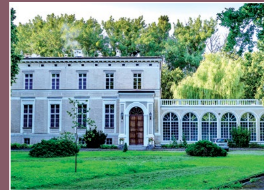
Pałac w Strzelcach Palast in Strzelce

W 1772 okolice Chodzieży zajmują Prusy; z krótką przerwą czasów Księstwa Warszawskiego 1806 – 1813, miasto i okolice do stycznia 1920 r. znajdują się pod zaborem pruskim.