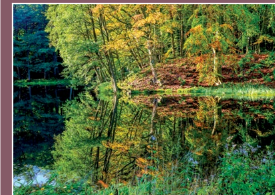
Leśny staw w Oleśnicy Waldteich in Oelsnitz

Na polach Podanina w porośniętych krzewami wzgórzach, nad tzw. Białymi Moczarami, w XIX w. odkopano kilka grobowców skrzynkowych z popielnicami, naczyniami glinianymi, kawałkami drutu brązowego, i koralami szklanymi. Dawniej odkryto tam trzy podobne groby, w jednym z nich znajdować się miały dwie popielnice, z których jedna wyobrażała twarz ludzką. Na innym pagórku odkryto rodzaj ganku podziemnego, wykładanego kamieniami, przed którym leżał okrągły głaz ze śladami rzeźby. W trzecim pagórku znajdował się stos kamieni, w nim spalone