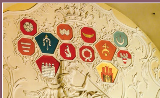
Herby rodów władających okolicami Chodzieży Wappen der in der Gegend von Chodziesen herrschenden Adelsgeschlechtern