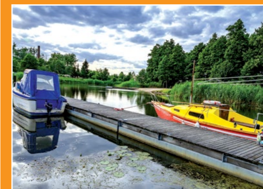
Przystań Yndzel Anlegestelle YNDZEL