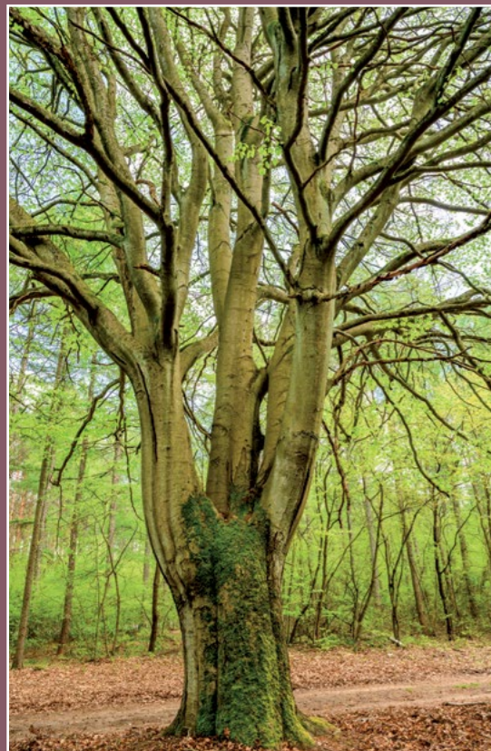
Pomnikowy buk w Ciszem Naturdenkmalbuche in Cisse