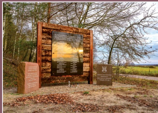
Pomnik Wzgórze Morzewskie Denkmal in Wzgórze Morzewskie