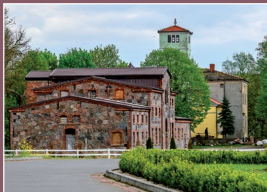
Budynki z kamienia polnego Häuser aus dem Feldstein