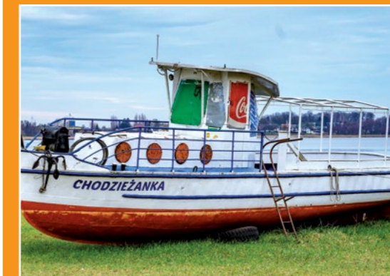
Statek Chodzieżanka Chodzieżanka Boot