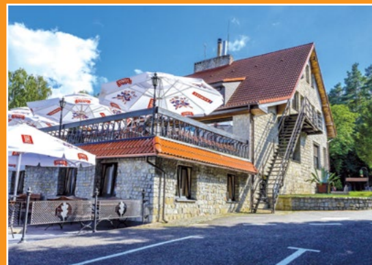
Gościniec Wyrwidąb Gasthof Wyrwidąb