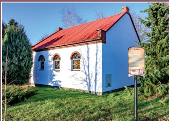
Dawna kuźnia Alte Schmiede