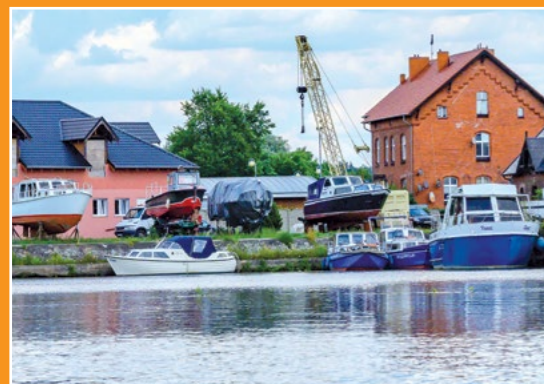
Stocznia w Czarnkowie Reparaturwerft in Czarnków