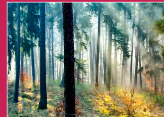
Lasy chodzieskie Chodziesen Wälder

Przy Domu Kultury bierze początek pieszy szlak czarny, biegnący przez lasy otaczające miasto od południa. Przejściem podziemnym pod drogą krajową 11 i ulicami miasta nad J. Miejskie. Ładną promenadą nad- jeziorną do Rataj, obok dużej plaży; skręcamy w lewo do szosy margoniń- skiej aby po paru metrach skrócić w prawo i pod górę pośród osiedla no- wych domów. Mijamy pozostałości cmentarza ewangelickiego (tylko kilka