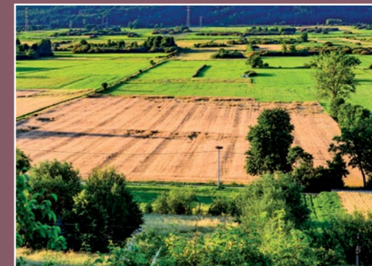
Nadnoteckie łąki k. Studzienica Netzewiesen bei Studzieniec