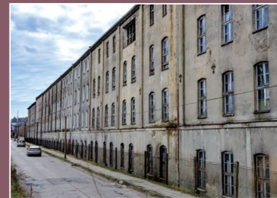
Dawna fabryka porcelany Alte Porzellanfabrik