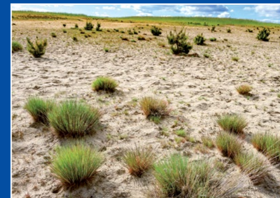
Nadnotecka wydma k. Konstątnowa Netzedüne bei Konstątnowa