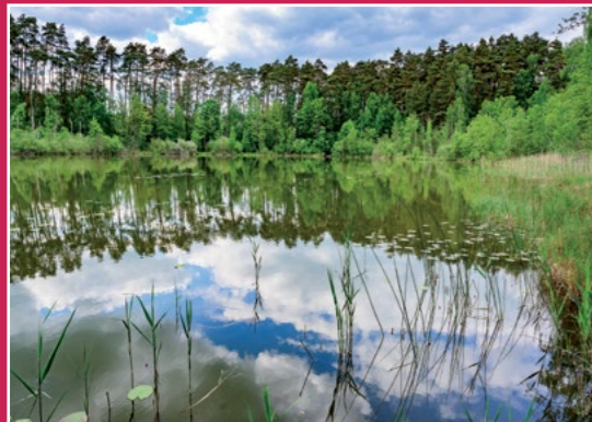
Jezioro przy szlaku czerwonym See am roten Wanderweg

Przez Gminę Chodzież prowadzą szlaki turystyczne piesze i rowe- rowe, wiele z nich wiedzie przez Gontyniec –najwyższe wzniesie- nie okolicy ( 192,5 m n.p.m.).