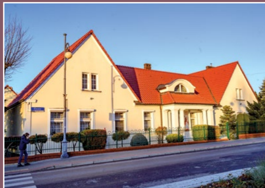
Plebania Chodzież Pfarrhaus in Chodziesen

W 1812 r. Napoleon nadaje 28 dawnych polskich majątków swoim oficerom; przez cały XIX w. wielu niemieckich chłopów przechowywało kwity jakie armia francuska dawała w latach 1806/1807 i 1812 za aprowizację.