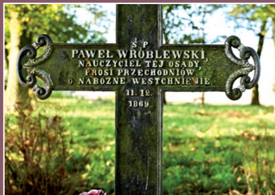
Grób dawnego nauczyciela z Nietuszkowa Grabmal des einstigen Lehrers aus Nietuszkowo