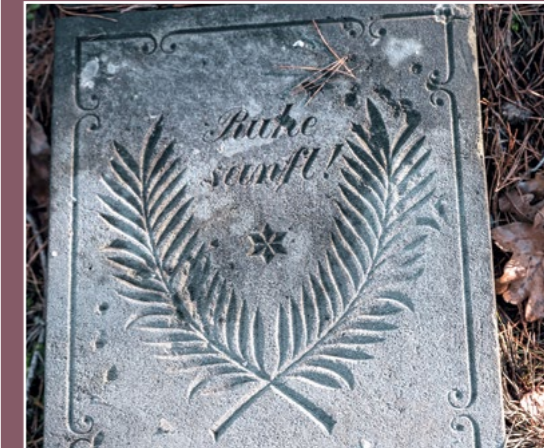
Niemiecki nagrobek Deutscher Grabstein