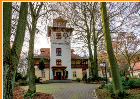
Gościniec Straszny Dwór Gasthof Schrecklicher Hof