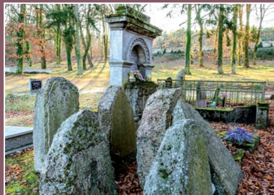
Cmentarz ewangelicki Evangelischer Friedhof