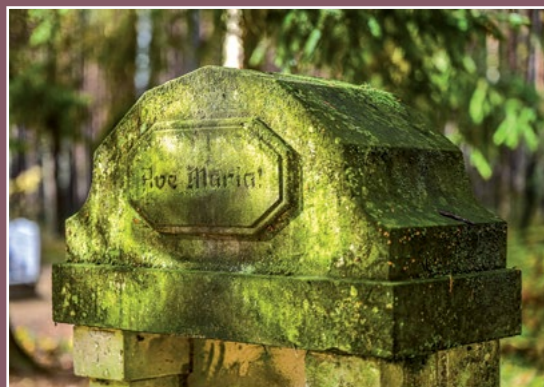
Cmentarz w Stróżewicach Friedhof in Stróżewice