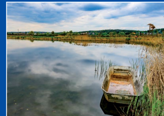
Staw w Oleśnicy Karpfenteich in Oelsnitz