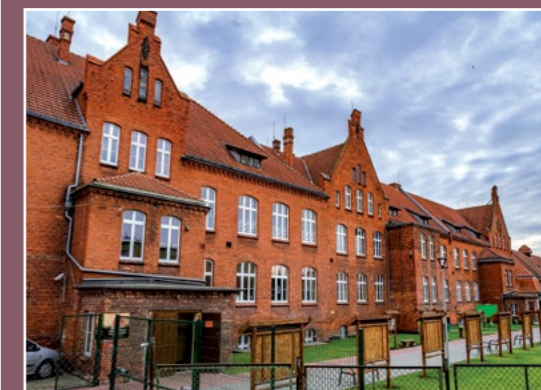
Szkoła św. Barbary Heilige Barbara Schule