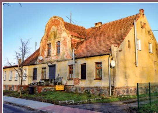
Dom w Podaninie Haus in Podanin

kości i nietknięte kły jakiegoś zwierzęcia, prawdopodobnie tura.