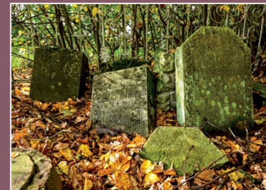
Nagrobki ewangelickie w Podaninie Evangelische Grabsteine in Podanin