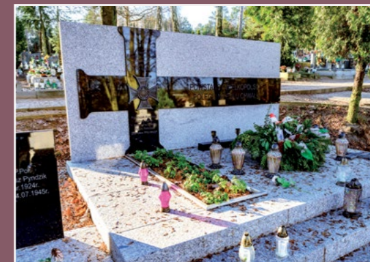
Grób powstańców wielkopolskich Grabmal der Groß Polnischen Aufständern