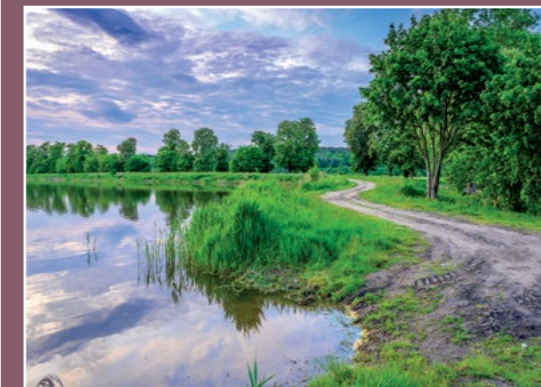
Staw w Oleśnicy Teich in Oelsnitz